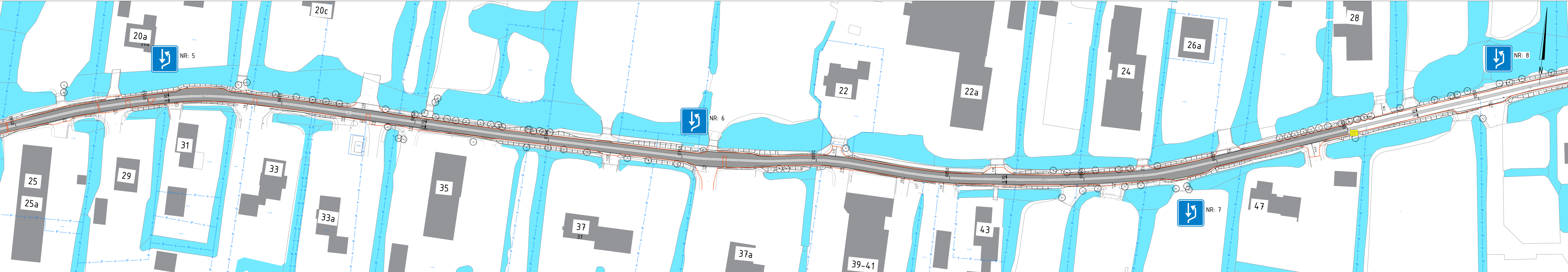
Situatie deel 2 Schaal 1500