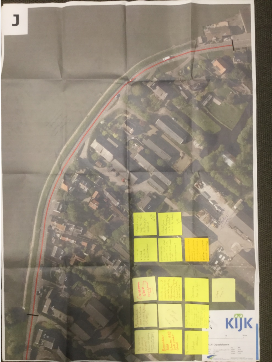
Bijlage - Foto met opbrengst van de avond