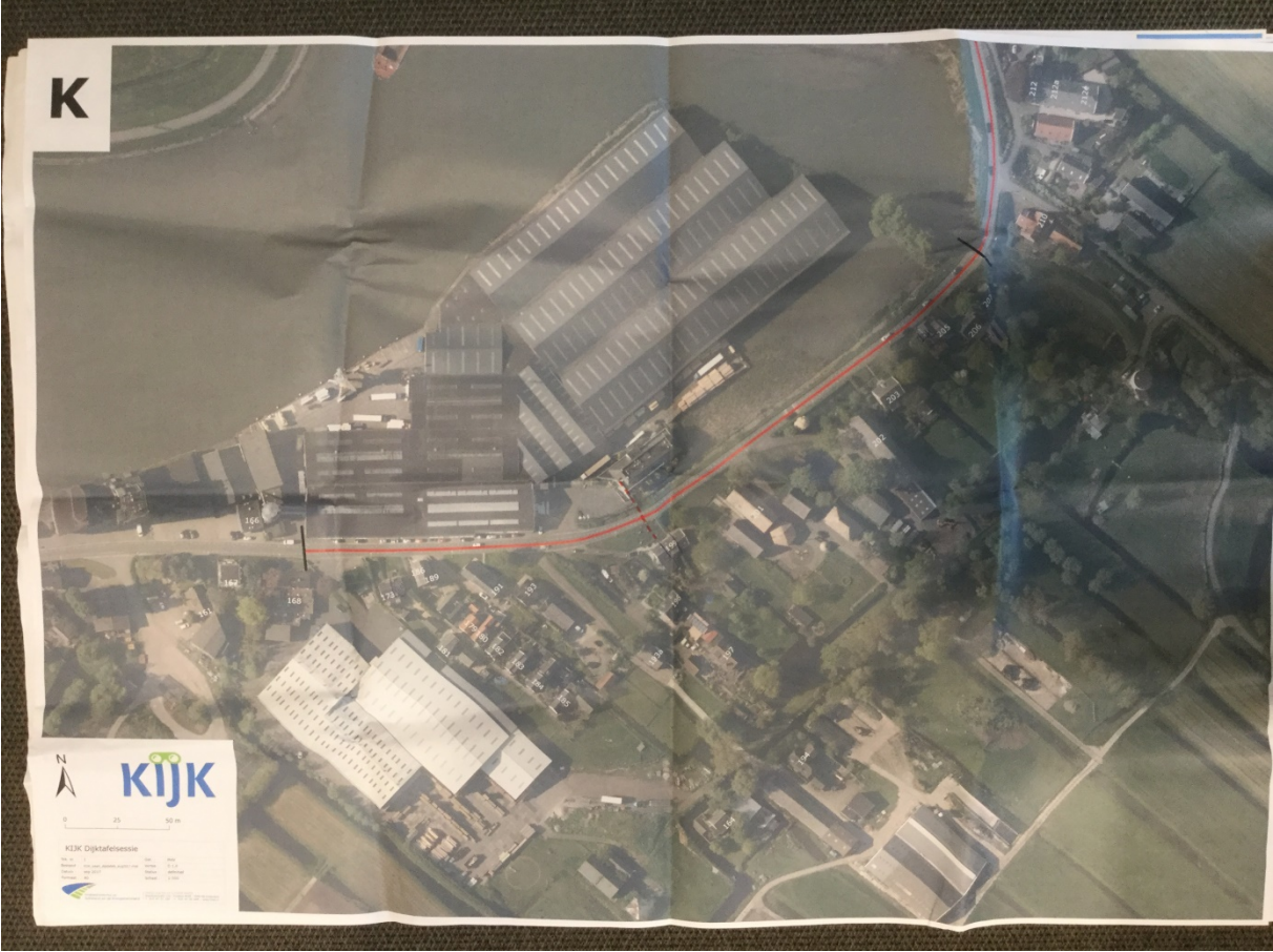
Bijlage - Foto met opbrengst van de avond