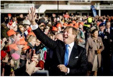
Koning Willem Alexander genoot gisteren in Krimpen aan den IJssel bij het begin van het streekbezoek.